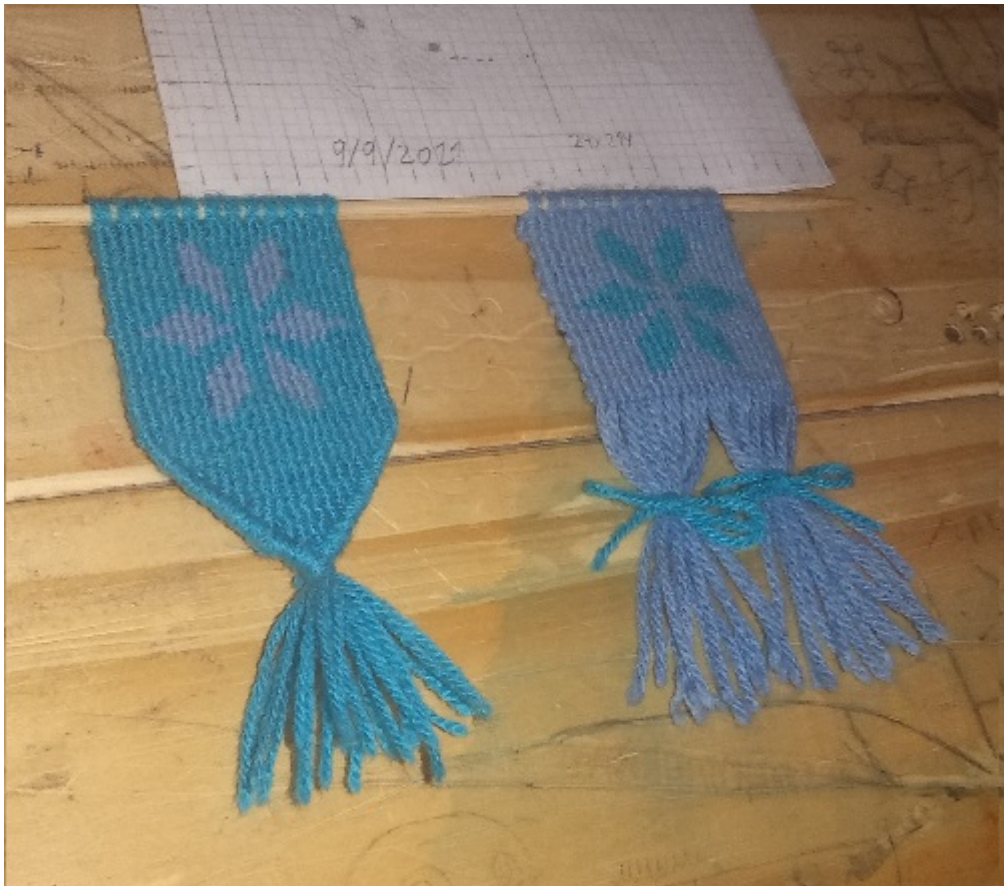
Tejidos a croché hechos por un anónimo - 09/09/2020-2021