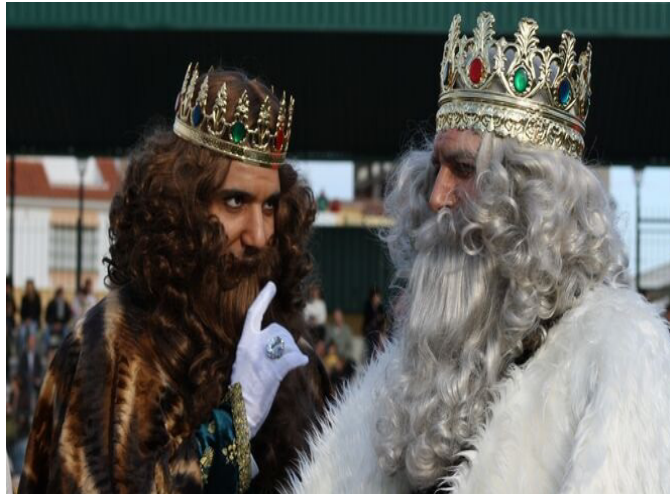
Yo quiero ir a la puta cabalgata de los Reyes Magos de Oriente de Asturias, España, y si no me dejan ir me voy a portar muy mal.

Yo quiero ir a la puta cabalgata de los Reyes Magos de Oriente de Asturias, España.