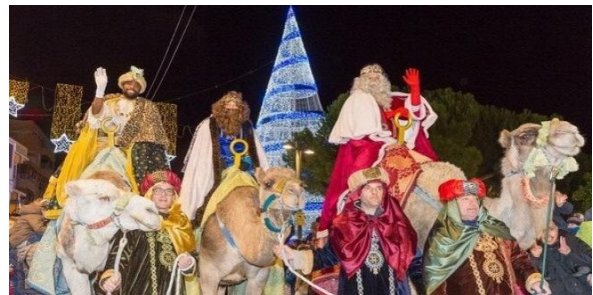
Yo quiero ir a la puta cabalgata de los Reyes Magos de Oriente de Madrid, España