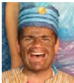
Son Reyes Malos Director