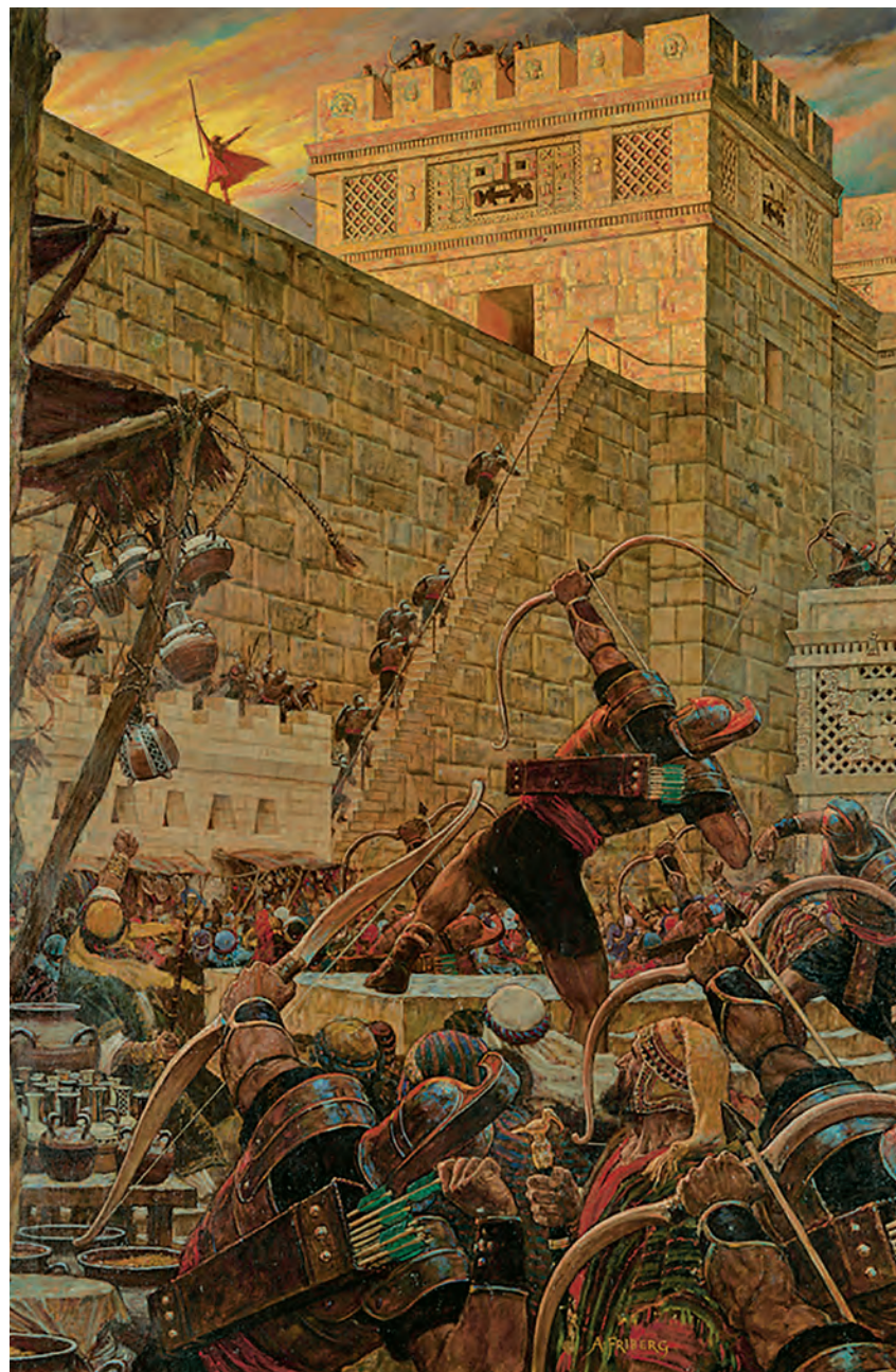
Samuel el Lamanita profetiza Pintura de Arnold Friberg