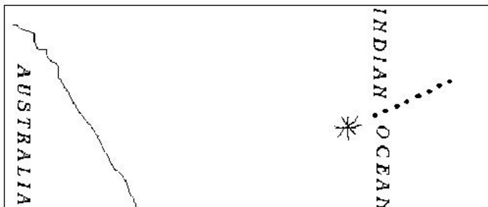
Ilustración 1: (La línea de puntos indica el curso que hemos seguido.)

El capitán Jones le dio la hoja y vio que por el otro lado era una carta náutica en cuyo margen había escritas las siguientes palabras: