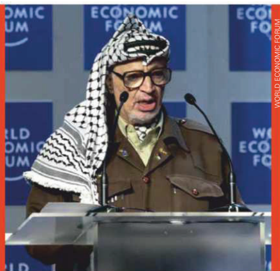
WORLD ECONOMIC FORUM