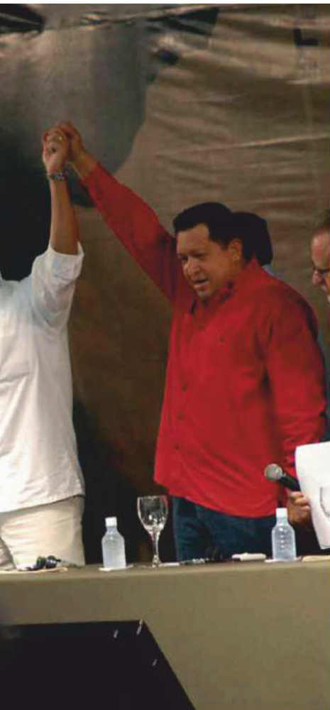
FABIO RODRIGUES POZZEBON/ABRWIKIPEDIA