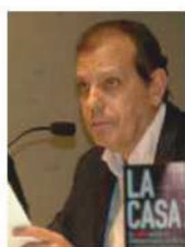
El periodista español Fernando Rueda (arriba) ha escrito numerosos libros sobre los servicios de inteligencia (abajo).